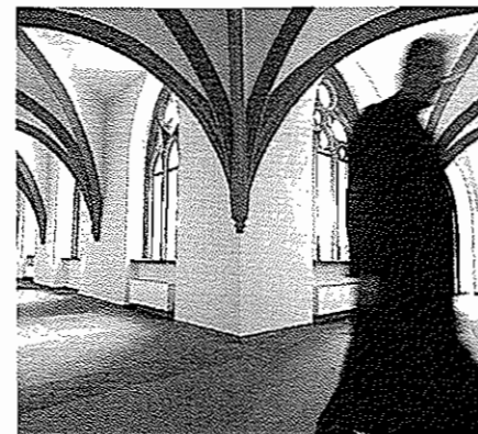
„Retreat“ in heiligen Hallen.